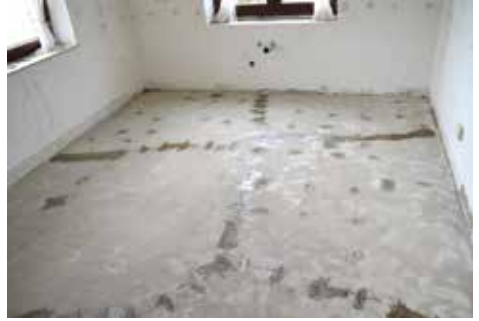
Bereitstellung einer ebenen, sauberen und trockenen Oberfläche.