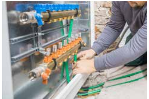
Anschluss der Fußbodenheizungsrohre an den Verteiler, Befüllung der Anlage mit Wasser und Dichtheitsprüfung.