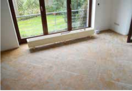
Entfernung der vorhandenen Oberbeläge/Heizkörper.

Egal, ob Sie Ihre neue Fußbodenheizung bei einer vorhandenen Niedertemperaturheizung einplanen, nach der Sanierung der Heizungsanlage auf Niedertemperatur umrüsten möchten oder die Flächenheizung in ein bestehende Hochtemperatur-Heizungsanlage einbinden wollen. Wir bieten für alle Varianten eine entsprechende Verteilerlösung.