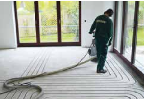
Nahezu staubfreie Kanalfräsung in den bestehenden Estrich durch erfahrenes Montageteam gemäß Verlegeplanung.