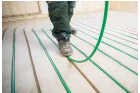
Verlegung der KLIMAPEX® Heizrohre in die gefrästen Kanäle.